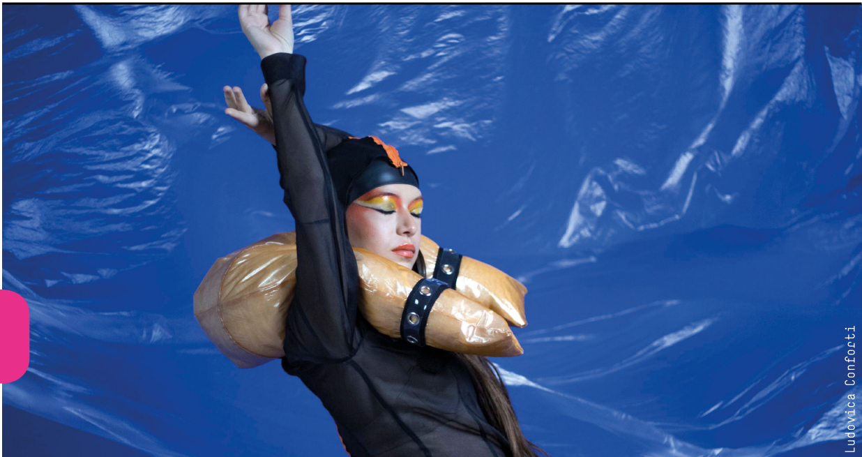
Work: LudoVica Conforti