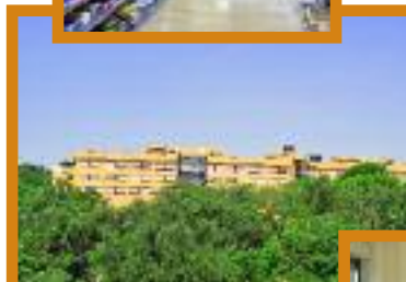
"Immersa nel verde"