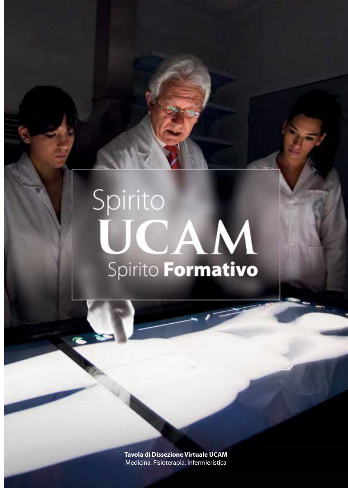
Tavola di Dissezione Virtuale UCAM Medicina, Fisioterapia, Infermieristica